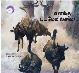
300 கதாவின் 300எம் திங்குடிகு டி