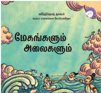
300 கதாவின் 300எம் திங்குடிகு டி