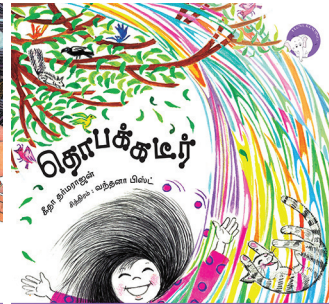
300 கதாவின் 300எம் திங்குடிகு டி