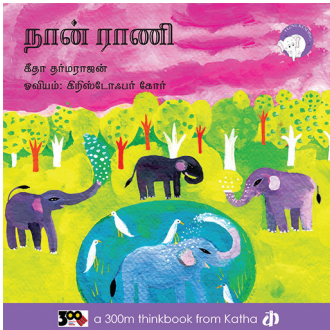
300 a 300m thinkbook from Katha டி