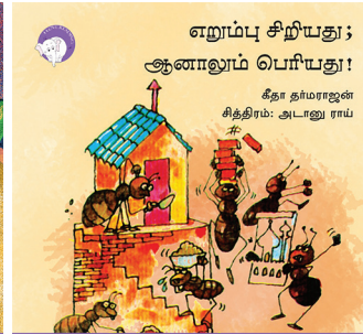
300 கதாவின் 300எம் திங்குடிகு டி