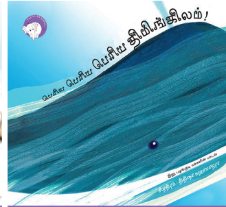
300 கதாவின் 300எம் திங்குடிகு டி