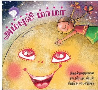
300 கதாவின் 300எம் திங்குடிகு டி