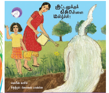
300 கதாவின் 300எம் திங்குடிகு டி