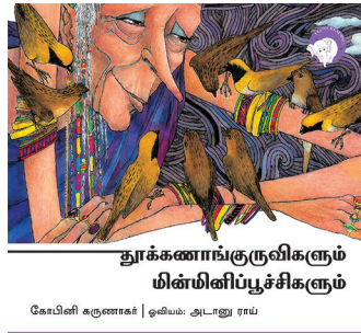
300 கதாவின் 300எம் திங்குடிகு டி