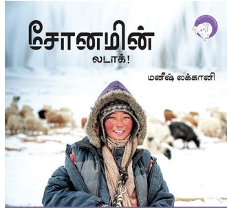
300 கதாவின் 300எம் திங்குடிகு டி