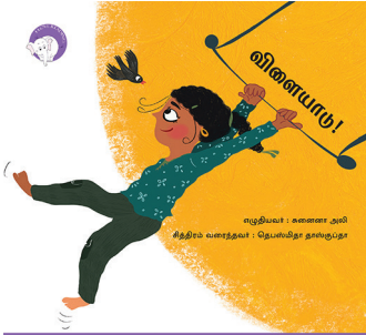
300 கதாவின் 300எம் திங்குடிகு டி