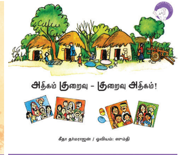
300 கதாவின் 300எம் திங்குடிகு டி