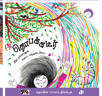
300 கதாவின் 300எம் திங்க்புக்