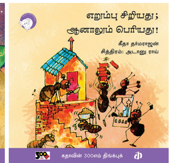
300 கதாவின் 300எம் திங்க்புக்