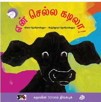
300 கதாவின் 300எம் திங்க்புக்