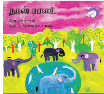
300 a 300m thinkbook from Katha