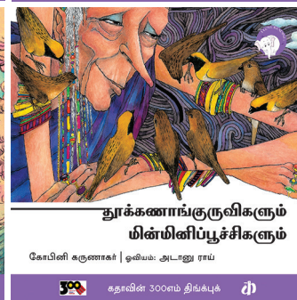
300 கதாவின் 300எம் திங்க்புக்