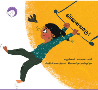
300 கதாவின் 300எம் திங்க்புக்