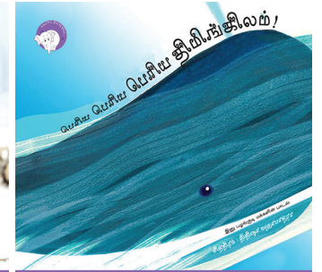
300 கதாவின் 300எம் திங்க்புக்