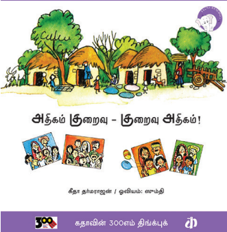
300 கதாவின் 300எம் திங்க்புக்