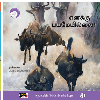
300 கதாவின் 300எம் திங்க்புக்