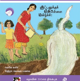
300 கதாவின் 300எம் திங்க்புக்