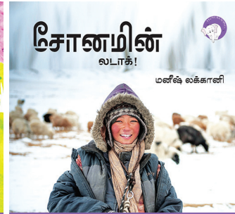
300 கதாவின் 300எம் திங்க்புக்