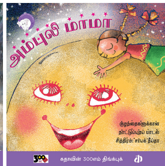
300 கதாவின் 300எம் திங்க்புக்