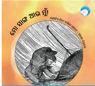
୨୨୦ ପସାର ଗୋଟିଏ 300ମି ଟିକା ବଚିନୀ ପାଇଁ ଶୋଭାକ ଯୋଗାଇଦିଏ ଏହି ଫି