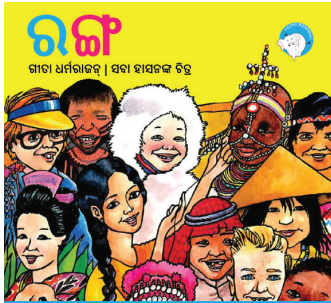
୨୨୦ ପସାର ଗୋଟିଏ 300ମି ଟିକା ବଚିନୀ ପାଇଁ ଶୋଭାକ ଯୋଗାଇଦିଏ ଏହି ଫି