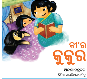
୨୨୦ ପସାର ଗୋଟିଏ 300ମି ଟିକା ବଚିନୀ ପାଇଁ ଶୋଭାକ ଯୋଗାଇଦିଏ ଏହି ଫି