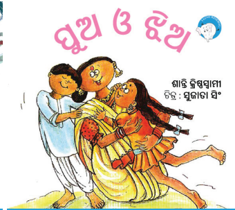
୨୨୦ ପସାର ଗୋଟିଏ 300ମି ଟିକା ବଚିନୀ ପାଇଁ ଶୋଭାକ ଯୋଗାଇଦିଏ ଏହି ଫି