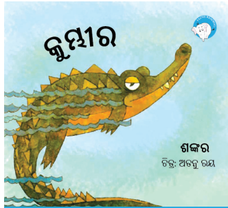
୨୨୦ ପସାର ଗୋଟିଏ 300ମି ଟିକା ବଚିନୀ ପାଇଁ ଶୋଭାକ ଯୋଗାଇଦିଏ ଏହି ଫି