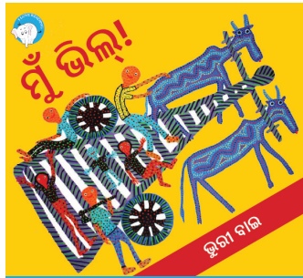
୨୨୦ ପସାର ଗୋଟିଏ 300ମି ଟିକା ବଚିନୀ ପାଇଁ ଶୋଭାକ ଯୋଗାଇଦିଏ ଏହି ଫି