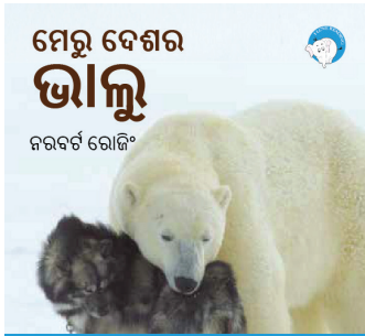
୨୨୦ ପସାର ଗୋଟିଏ 300ମି ଟିକା ବଚିନୀ ପାଇଁ ଶୋଭାକ ଯୋଗାଇଦିଏ ଏହି ଫି