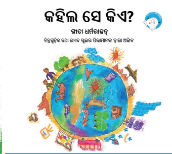
୨୨୦ ପସାର ଗୋଟିଏ 300ମି ଟିକା ବଚିନୀ ପାଇଁ ଶୋଭାକ ଯୋଗାଇଦିଏ ଏହି ଫି