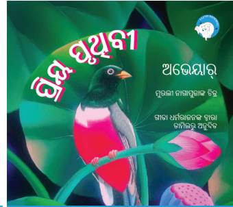
୨୨୦ ପସାର ଗୋଟିଏ 300ମି ଟିକା ବଚିନୀ ପାଇଁ ଶୋଭାକ ଯୋଗାଇଦିଏ ଏହି ଫି