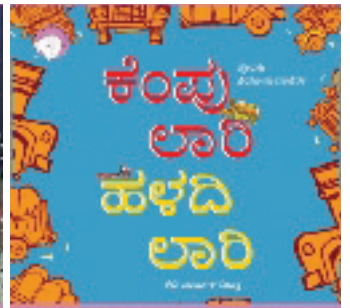
₹೦೦ ಕಥಾವಿಡು ಒಂದು 300ನು ಥುಕಾಯಾ ಕೃ