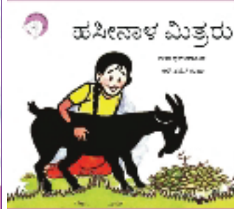
₹೦೦ ಕಥಾವಿಡು ಒಂದು 300ನು ಥುಕಾಯಾ ಕೃ