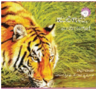
₹೦೦ ಕಥಾವಿಡು ಒಂದು 300ನು ಥುಕಾಯಾ ಕೃ