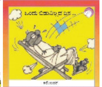
₹೦೦ ಕಥಾವಿಡು ಒಂದು 300ನು ಥುಕಾಯಾ ಕೃ