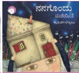
₹೦೦ ಕಥಾವಿಡು ಒಂದು 300ನು ಥುಕಾಯಾ ಕೃ