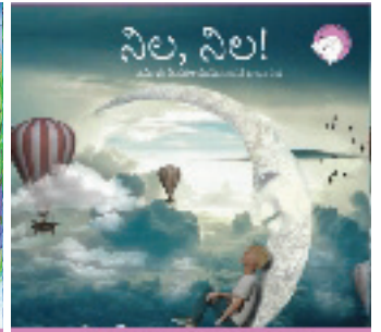
₹೦೦ ಕಥಾವಿಡು ಒಂದು 300ನು ಥುಕಾಯಾ ಕೃ