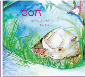
₹೦೦ ಕಥಾವಿಡು ಒಂದು 300ನು ಥುಕಾಯಾ ಕೃ