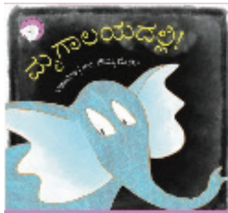
₹೦೦ ಕಥಾವಿಡು ಒಂದು 300ನು ಥುಕಾಯಾ ಕೃ