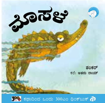
ಕಥಾದಿಂದ ಓಂದು 300ಎಂ ಥಿಂಕ್‌ಬುಕ್ ಥಿ