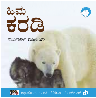
ಕಥಾದಿಂದ ಓಂದು 300ಎಂ ಥಿಂಕ್‌ಬುಕ್ ಥಿ