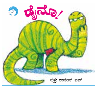
ಕಥಾದಿಂದ ಓಂದು 300ಎಂ ಥಿಂಕ್‌ಬುಕ್ ಥಿ