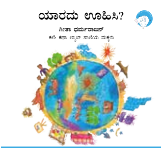
ಕಥಾದಿಂದ ಓಂದು 300ಎಂ ಥಿಂಕ್‌ಬುಕ್ ಥಿ