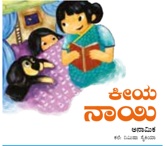
ಕಥಾದಿಂದ ಓಂದು 300ಎಂ ಥಿಂಕ್‌ಬುಕ್ ಥಿ