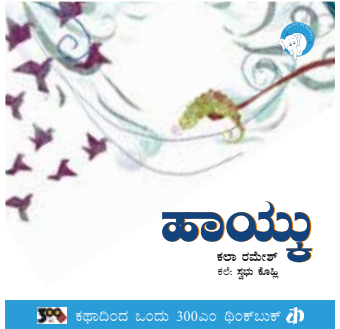
ಕಥಾದಿಂದ ಓಂದು 300ಎಂ ಥಿಂಕ್‌ಬುಕ್ ಥಿ