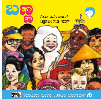
ಕಥಾದಿಂದ ಓಂದು 300ಎಂ ಥಿಂಕ್‌ಬುಕ್ ಥಿ