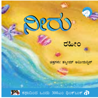
ಕಥಾದಿಂದ ಓಂದು 300ಎಂ ಥಿಂಕ್‌ಬುಕ್ ಥಿ