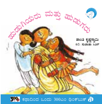
ಕಥಾದಿಂದ ಓಂದು 300ಎಂ ಥಿಂಕ್‌ಬುಕ್ ಥಿ