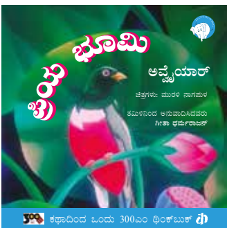
ಕಥಾದಿಂದ ಓಂದು 300ಎಂ ಥಿಂಕ್‌ಬುಕ್ ಥಿ