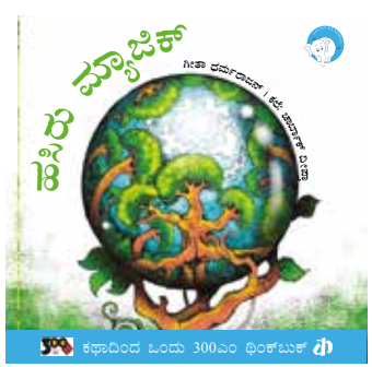
ಕಥಾದಿಂದ ಓಂದು 300ಎಂ ಥಿಂಕ್‌ಬುಕ್ ಥಿ