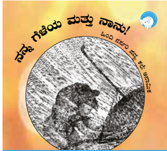
ಕಥಾದಿಂದ ಓಂದು 300ಎಂ ಥಿಂಕ್‌ಬುಕ್ ಥಿ