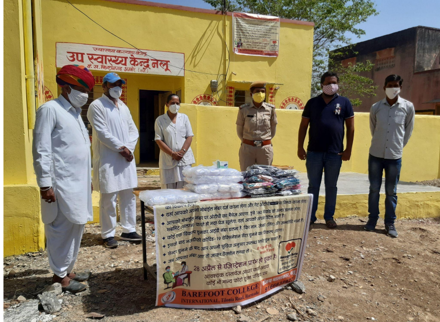
Resource distribution of mask and sanitizer in Kishangarh, Ajmer (Rajasthan)